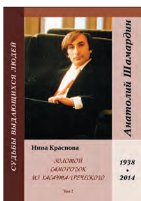
Нина Краснова Золотой самородок из Хасаута-Греческого, том 2 М.: «Вест-Консалтинг», 2020