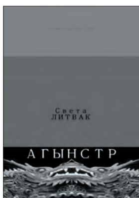
Света Литвак Агынстр М.: «Вест-Консалтинг», 2020