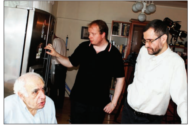
Оживленная дискуссия между съемками