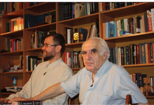
Евгений Рейн на фоне библиотеки Евгения Степанова