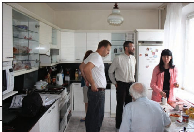
Съемочная бригада и гости программ