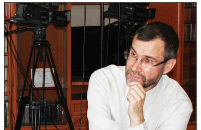
Между записями программ