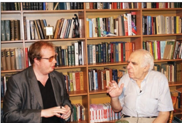
Беседа с Евгением Рейном