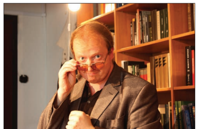
До встречи в эфире!