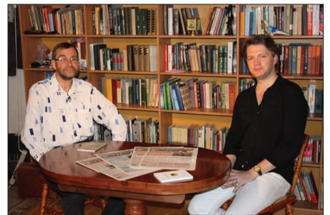
Перед началом записи