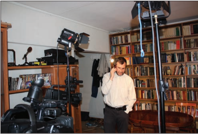
Как там дела в Союзе писателей XXI века и в «Вест-Консалтинге»?