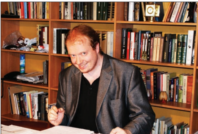
В начале съемочного дня