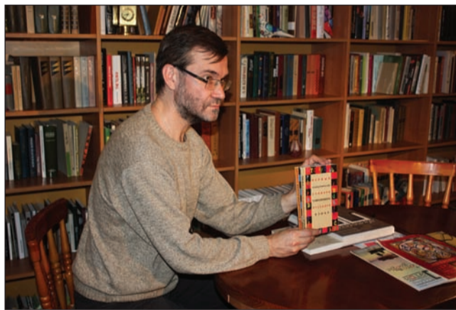
Библиотека Евгения Степанова