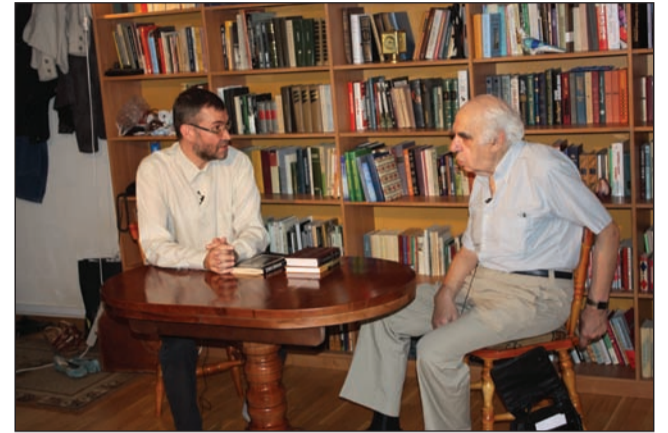
Беседа с Евгением Рейном