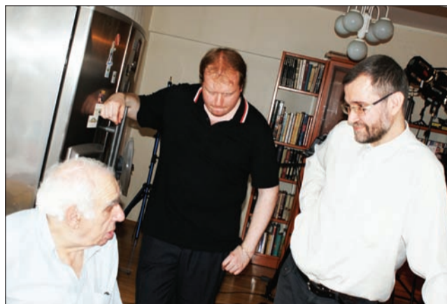
Евгений Рейн вспоминает о славном литературном прошлом