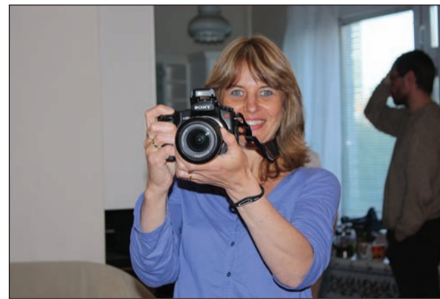
Каждый момент съемок должен быть увековечен!