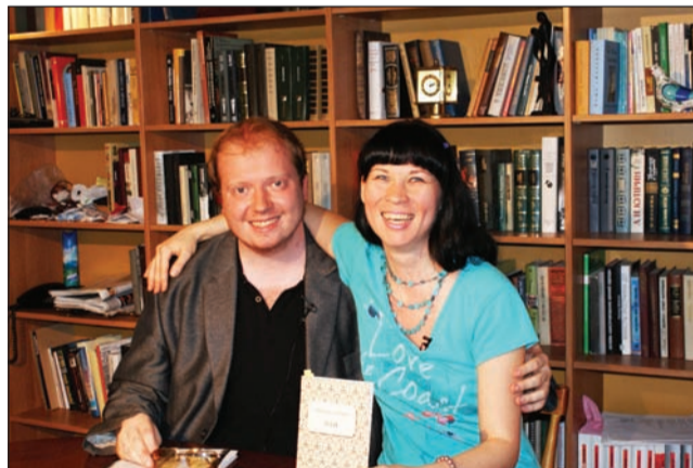
После записи грех не сфотографироваться на память!