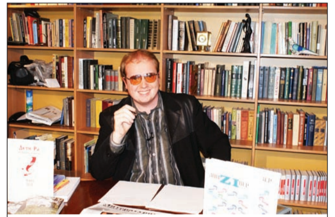
Все будет хорошо!