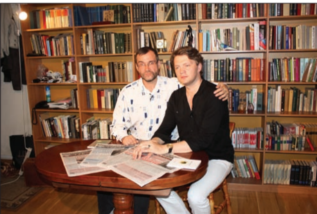
Фотография после съемок