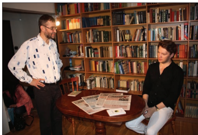
Обсуждение будущего выпуска программы