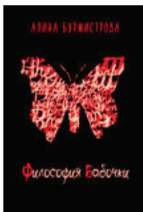
Алина Бурмистрова «Философия бабочки» М.: «Вест-Консалтинг», 2015