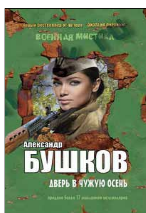
Александр Бушков «Дверь в чужую осень» ДИПик «Капитал», 2015