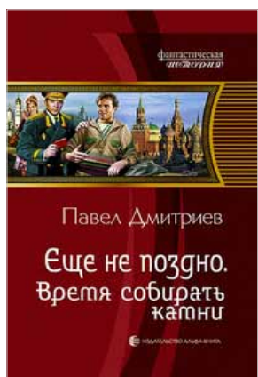
Павел Дмитриев «Еще не поздно. Время собирать камни» М.: «Альфа-книга», 2015