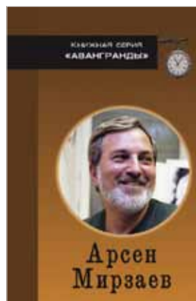
Арсен Мирзаев «Жизнь в 3/4»